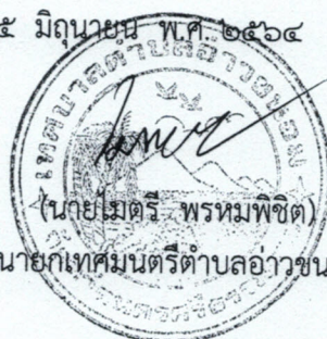
นายกเทศมนตรีตำบลอ่าวขนอม